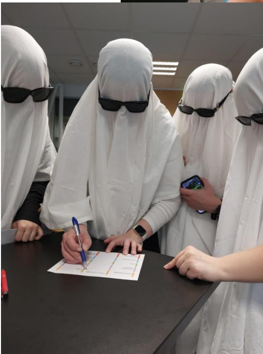
Parhaan puvun palkinnon voittanut opiskelijaryhmä.